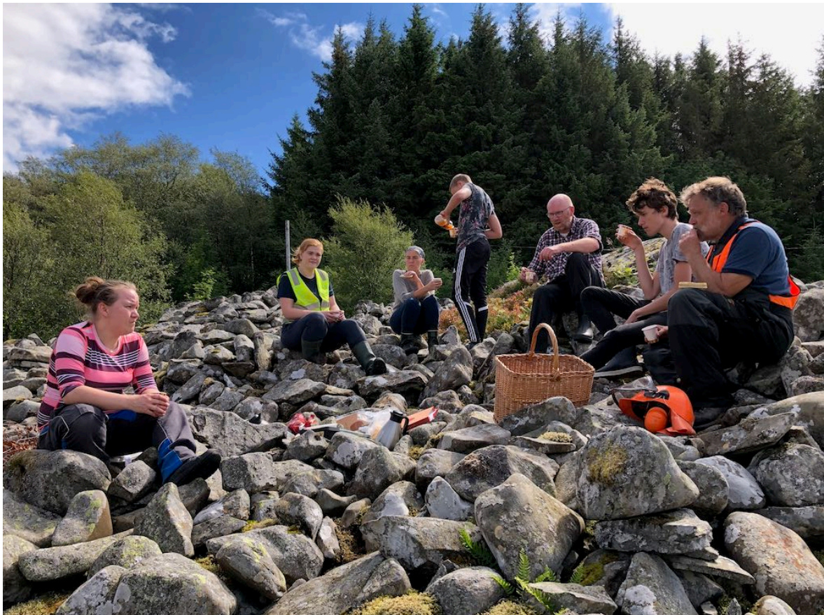
Frå ein av dugnadane på gravrøysa i Vikja.