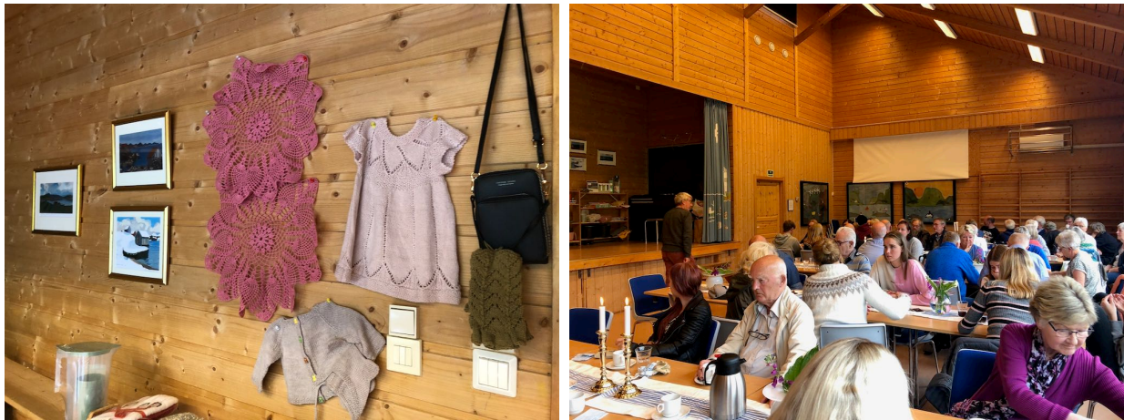
Sommarbasaren samla bra med folk og gav bra med pengar i kassa til grendalaget.