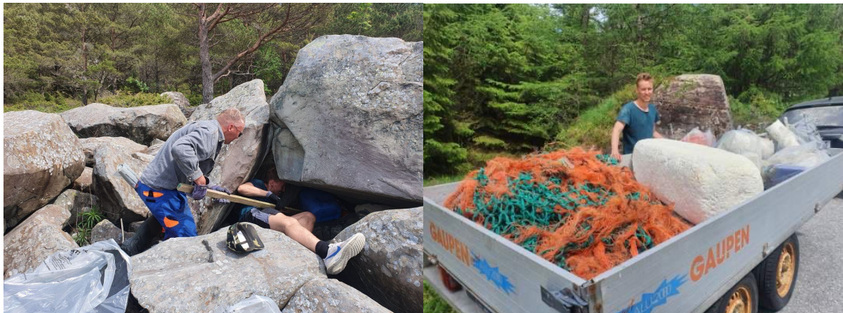
Det vart rydda over alt under strandryddeaksjonen.

I samband med søndagskafeen i juni vart ei fast, fin utstilling med digitale bilete av Fridtjov Urdal opna på grendahuset på Årebrot.