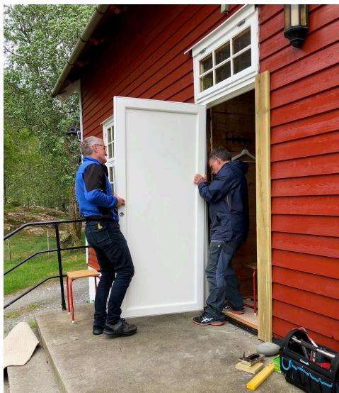
Det er sett inn nye ytterdører på framsida av grendahuset i Botnane.

Heile framsida på huset og delar av vestveggen vart måla på dugnad i juni. Det vart ordna ute med blommar og anna og vaska i sløydsalen på dugnad.