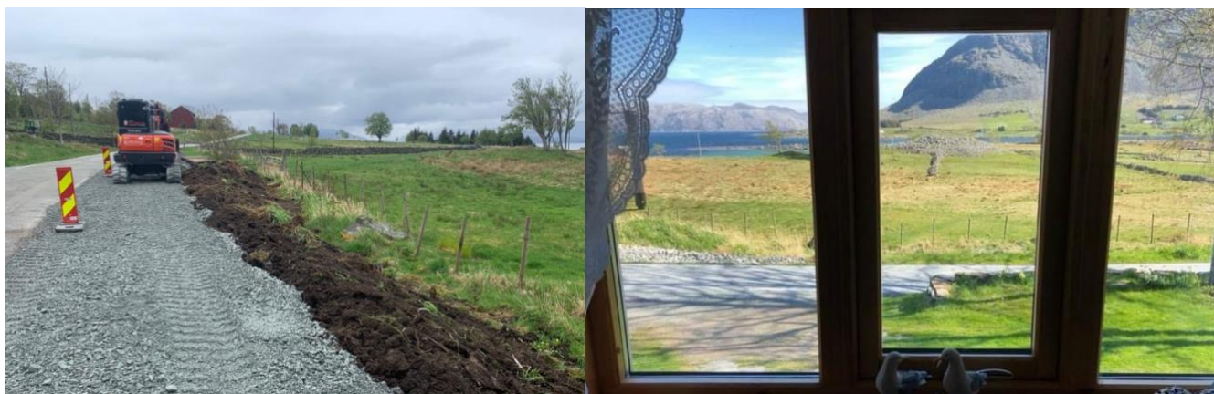
Med støtte frå næringsfondet i Bremanger fekk grendalaget bygd ei enkel utkjøring ved den store røysa i Sørbotten.