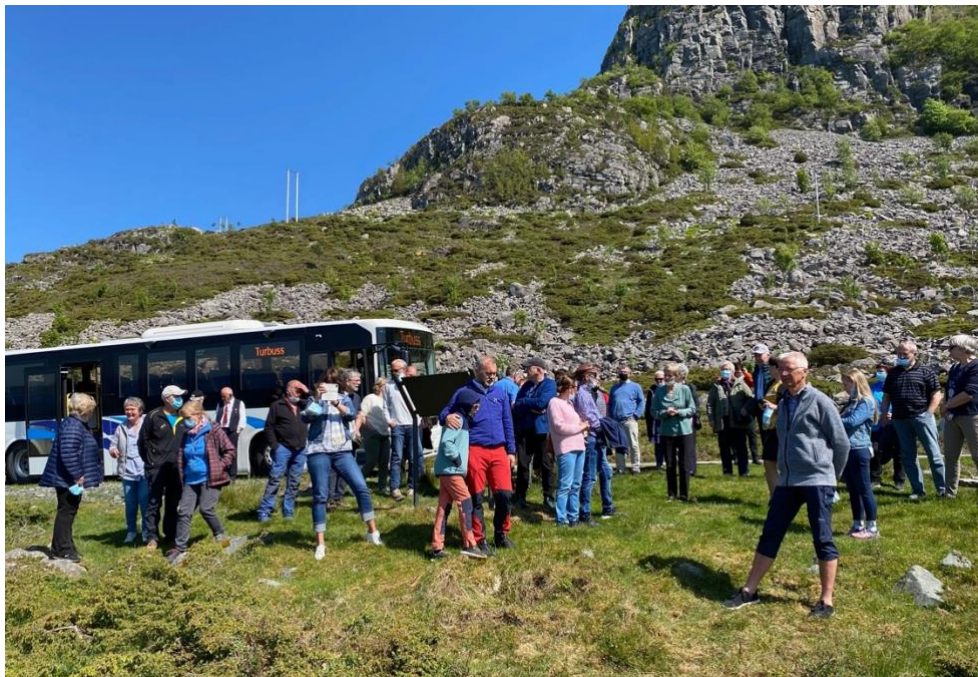
Alle som var med på bussturen frå Sletten til Villevika på opninga av kulturminneløypa, samla ved Opnarhella