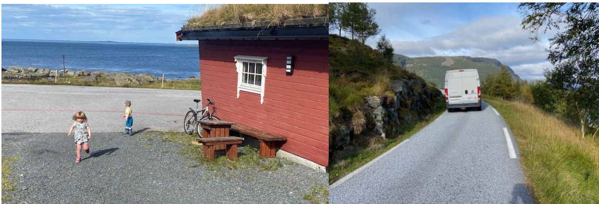
Frøysjøvegen må utbetrast frå Myklebustkrysset til Villevika - og gjennom Botnane må det verte redusert fartsgrense!

Vi har ikkje kome lengre med å legge turstiane inn på ulike digitale kart og plattformer, mellom anna ut.no. Det er heller ikkje merka fleire nærturar og ein kom ikkje i gang med stolpejakt/turorientering.